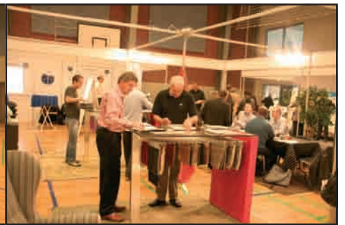
Vævergården viser nyhederne frem