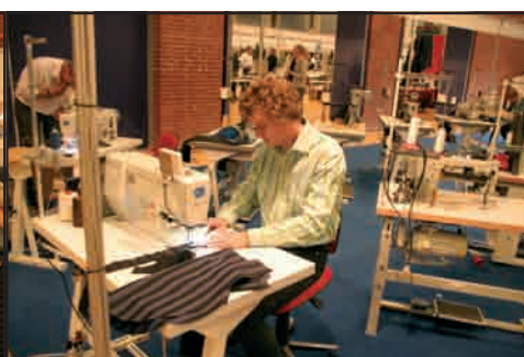
Det var bare at holde tungen lige i munden med alle de striber