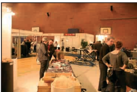
Der er godt gang i ordrebøgerne hos Nevotex