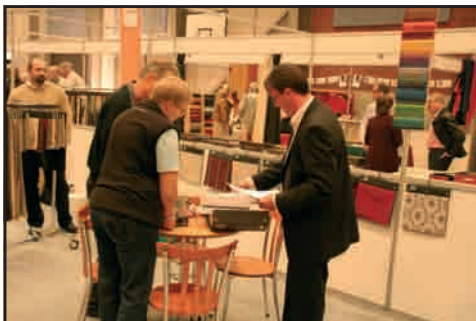
SRJ præsenterer nyhederne