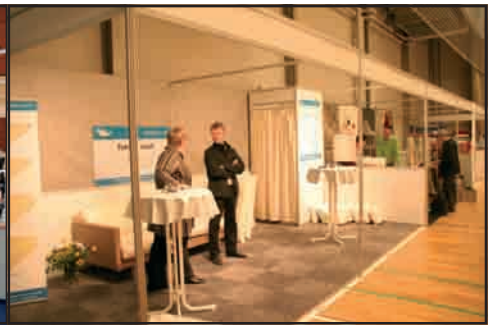
Sekunderne før messen åbner hos Nortex