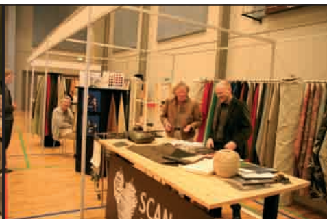
Scan Aprima præsenterer deres store kollektion