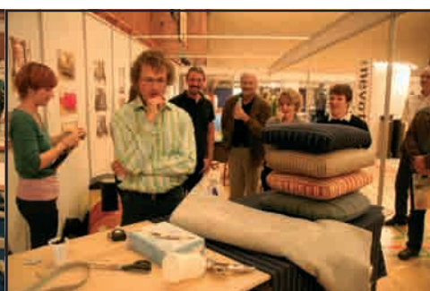
Det var nogle flotte resultater, der blev leveret af eleverne

Landslauget vil gerne takke vores sponser ved konkurrencen for skolens elever.