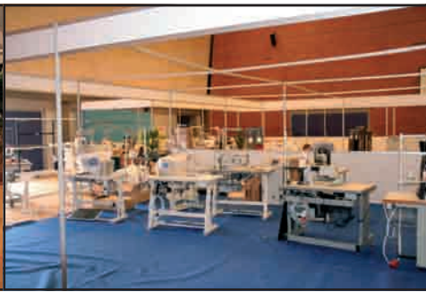
Scanteam under opbygning