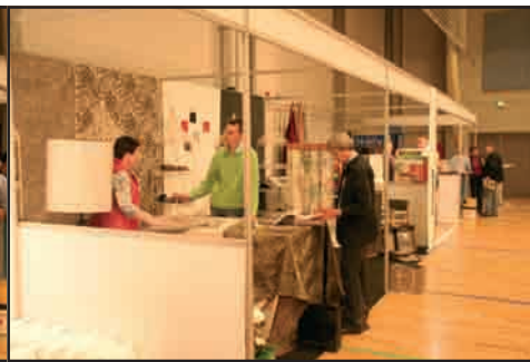
Selv om LP trading kom med i sidste sekund blev den flotte kollektion beundret