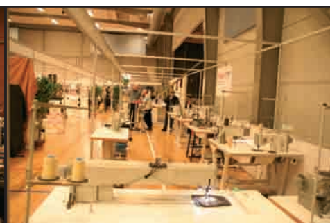
Pfaff havde flere gode tilbud.