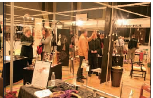
Århus Possement fremviser nyt possement